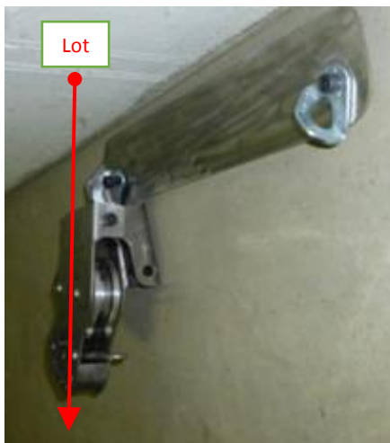
Beispiel Foto Wandmontag mit Montagekonsole mit horizontalen Befestigungen