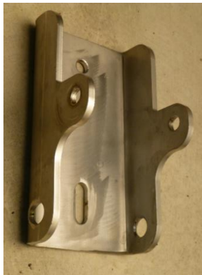
Montagekonsole mit Vertikalen Befestigungspunkten