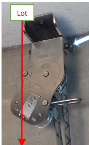
Beispiel Foto: richtige Deckenmontage