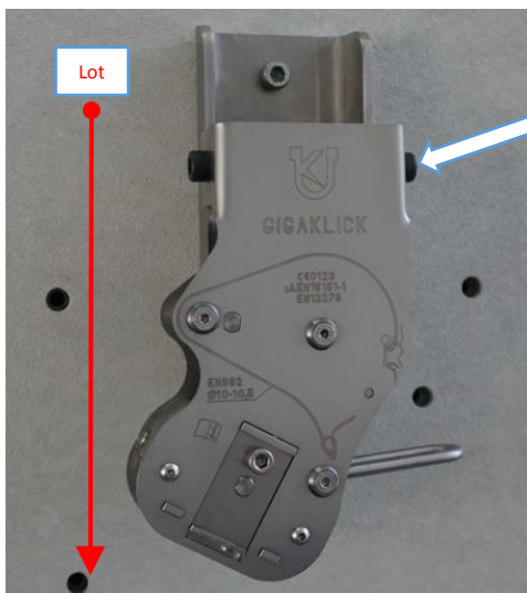
Beispiel Foto: richtige Wandmontage mit Montagekonsole mit vertikaler Befestigung